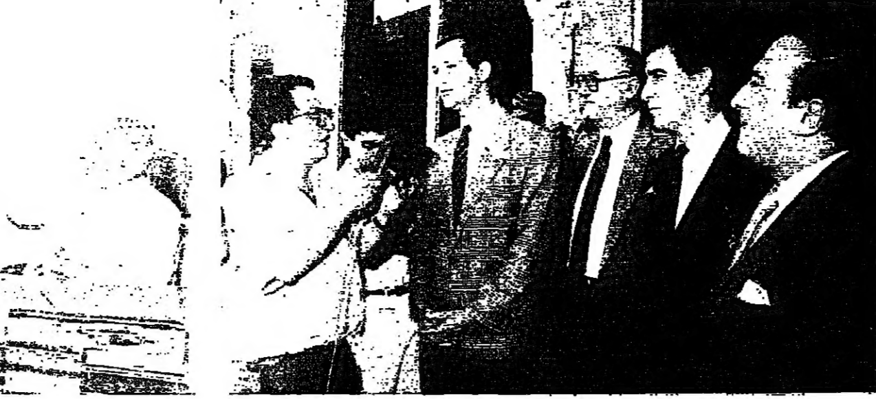
وعلى أبواب قصر بعبدا